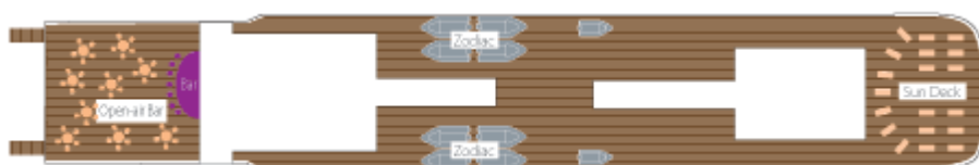
Bar Extérieur - Sun deck